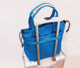
背面のベルトはキャリーケースのハンドルを通して固定できる便利な仕様。