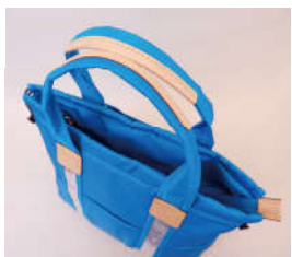
メイン開閉はファスナータイプ。