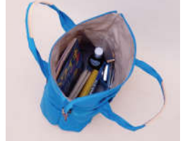
A4サイズがタテ方向に収納可能。普段使いに丁度良いサイズ。