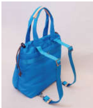
身体に沿ったデザインのストラップ。適度に厚みを持たせ、ソフトな使用感。