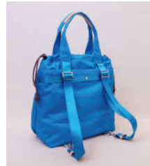
リュックサックススタイルと、トートスタイルの2WAY仕様。毎日使いたくなる機能が満載。