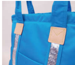
イタリアは、トスカーナ地方伝統の植物渋タンニンなめし革を使用しているので高級感抜群。