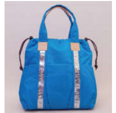
前面にはオープンポケットが3つ。直取り出ししたい物の収納に。