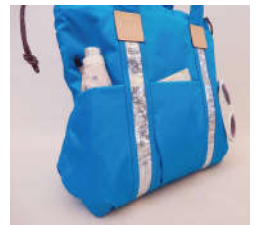
背面側にはタテにひらくファスナーポケット。地図を持って出かけも◎。