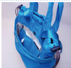
リュックストラップは背面側のハンドル付け根のポケットに収納可能。