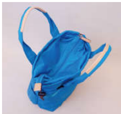
メイン室は大きく開き、内装も充実。大小タイプの異なる収納が便利。